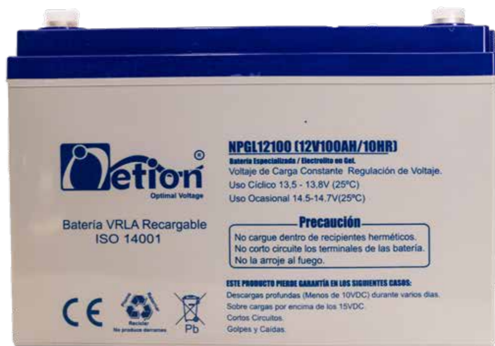
● Imagen de referencia