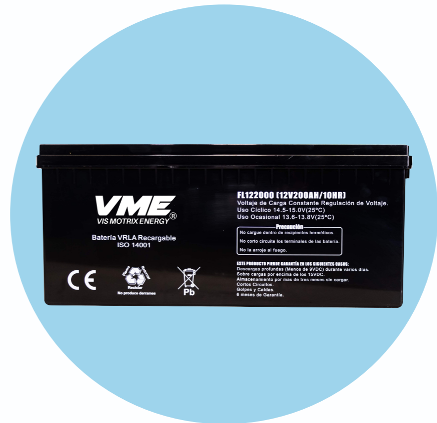
Batería VME AGM 12V-200 AH