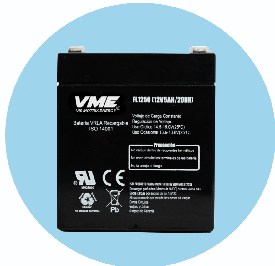
Batería VME AGM 12V-5AH