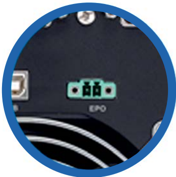
Función opcional de Apagado de Emergencia (EPO)