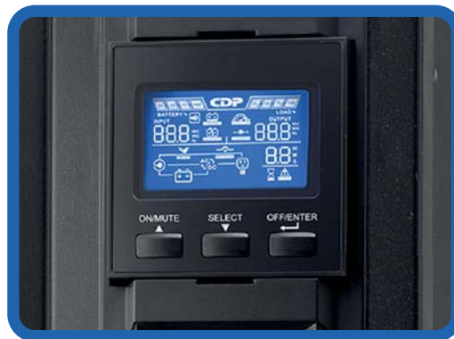
Display LCD Muestra voltajes de entrada, salida, tiempos de autonomía y carga de batería.