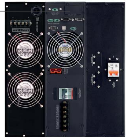
Transformador de aislamiento