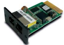
Tarjeta opcional: EMD (Dispositivo de monitoreo ambiental) para que pueda operar se necesita tener la SNMP instalada