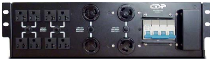
UPO22-PDU 6-10k Compatible con unidad de distribución de energía (PDU) se vende por separado

Interfaz de sincronización para configuración de paralelo redundante N+1 (opcional)