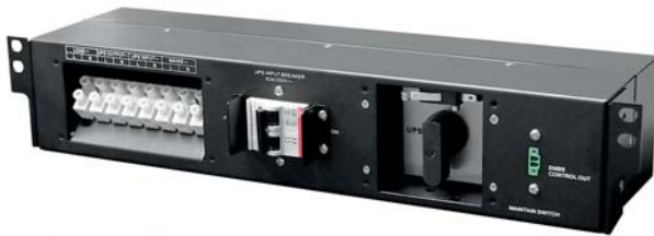
Conmutador de Bypass de mantenimiento

Velocidad de 2 ventiladores controlado por nivel de carga