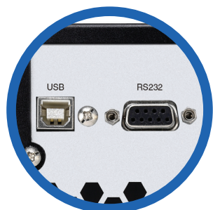
Puertos de comunicación