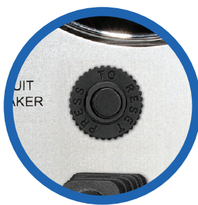
Breaker de protección