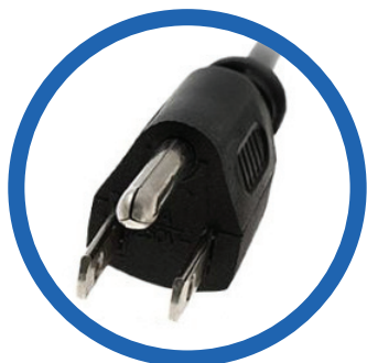
Cable de alimentación CA NEMA 5-15P