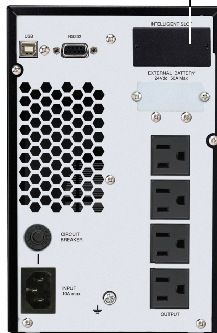
Tarjeta opcional: SNMP