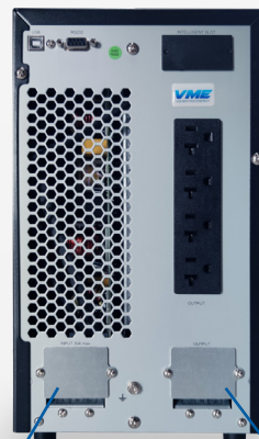
Bornera de alimentación máxima potencia