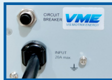
Breaker de circuito de protección