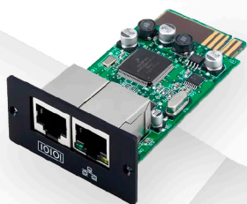
TARJETA DE RED SNMP (opcional)