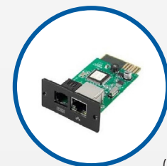
Tarjeta SNMP (opcional)