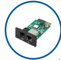
Tarjeta SNMP (opcional)