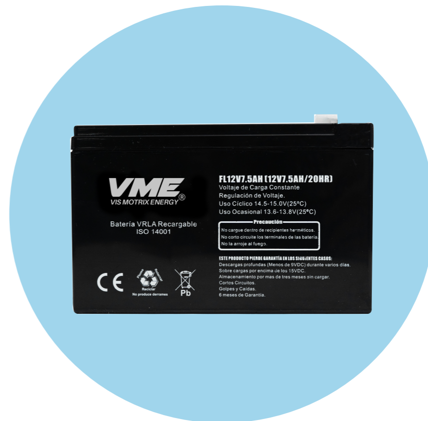
Batería VME AGM 12v 7.5